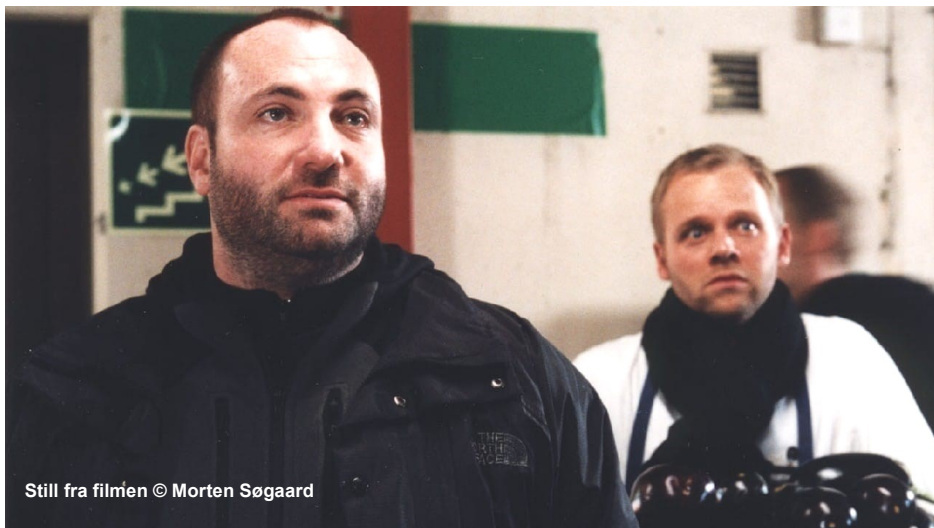
Still fra filmen

Du slog for alvor igennem som instruktør med I Kina spiser de hunde (1999). Den lavede du uden støtte fra Filminstituttet ?