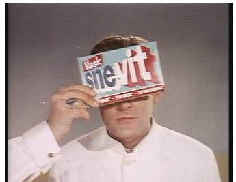
Her ses Ove Sprogøe i en af sine sjældne reklamefilm. Denne er fra 1956.

Jeg er ikke interesseret i at vise mit privatliv frem, men det er ikke noget princip.