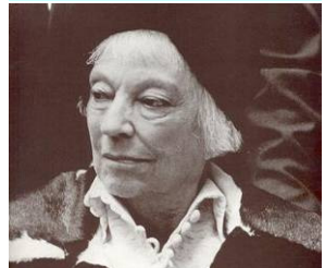
Asta Nielsen på sin 90-års fødselsdag 11/9-1971.

Vi fik the af et meget smukt stel, som jeg arvede, da hun døde i 1972.